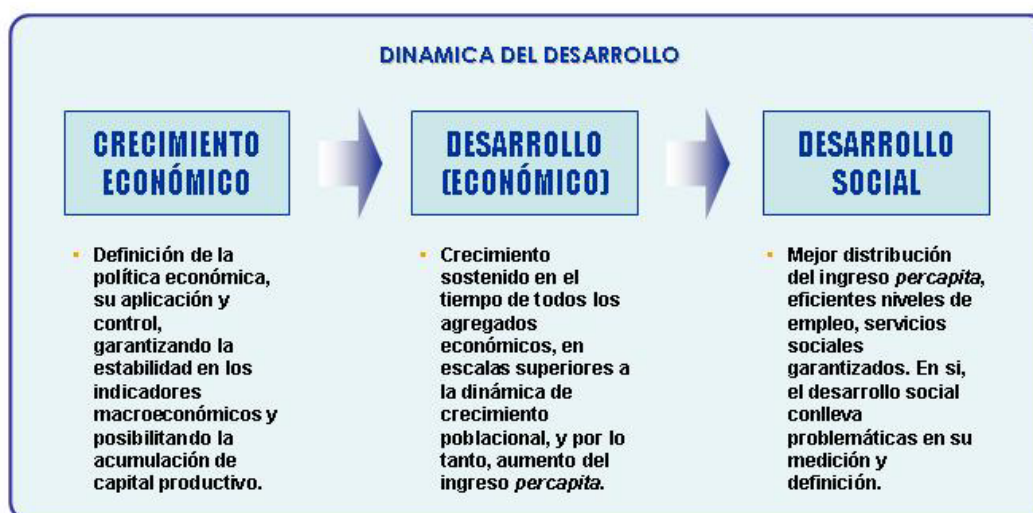
Diagrama 1: Dinámica del desarrollo

Las teorías del desarrollo –y los retos que este proceso conlleva– se han centrado en sus aspectos económicos: la definición de las políticas monetaria y fiscal, el control de la dinámica de los agregados macroeconómicos –inflación y tasas de interés– los déficit presupuestales, la balanza de pagos y demás elementos que condicionan el crecimiento, pero siempre desde una visión económica y por lo tanto parcial. Desde esta vertiente económica, una sociedad es desarrollada cuando cuenta con la capacidad propia y auto reproducible para lograr aumentos significativos en la productividad per capita, y por lo tanto es capaz de resolver sus necesidades sociales, las cuales están en constante transformación como consecuencia de su propia capacidad productiva (ver Diagrama 1).